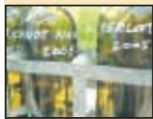
Les vins romands sont réussis. AJT