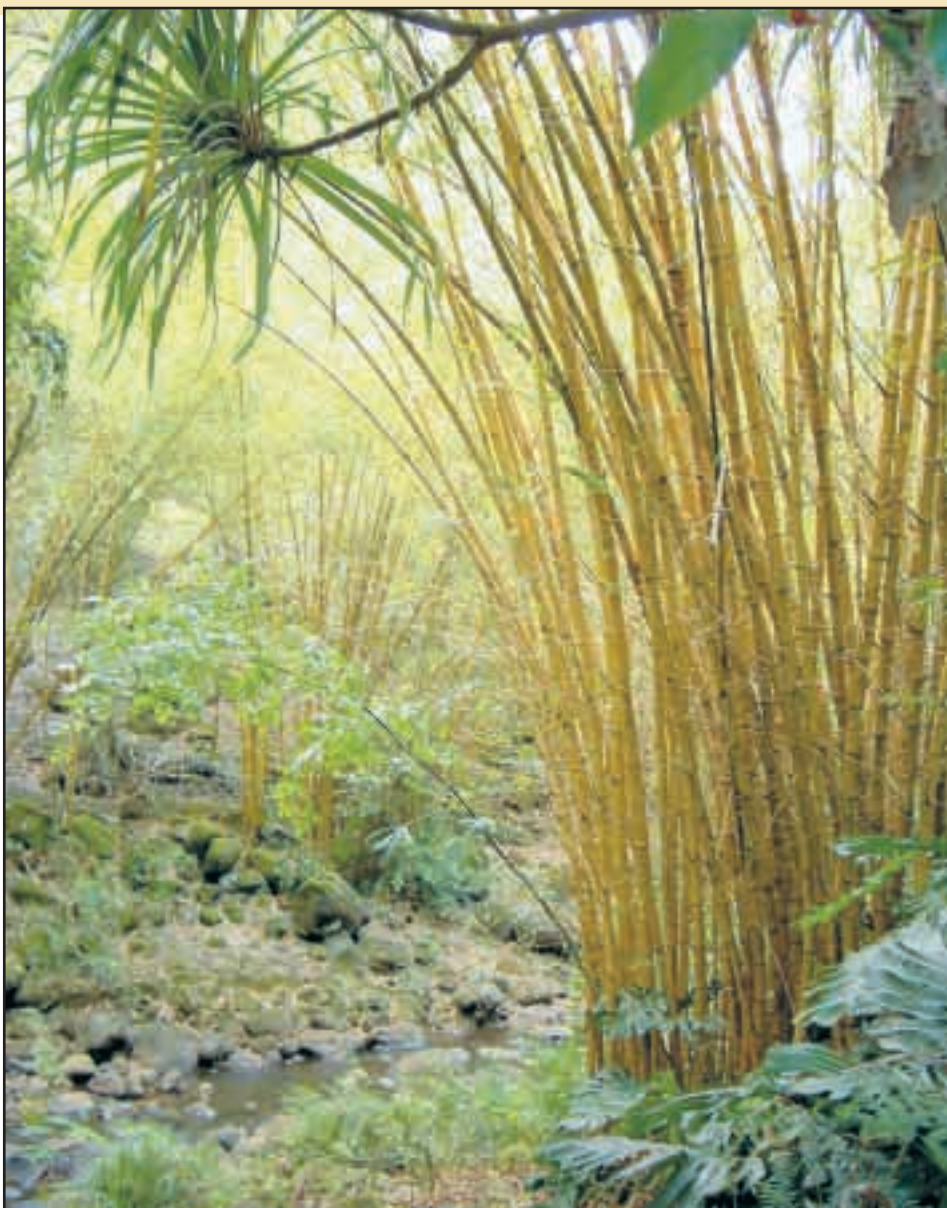
Une plante qui repousse de vingt mètres en deux mois.

Les stylistes suivent le mouvement. Des marques comme Blue Dog, Les Ateliers de la maille ou Mango, Barbara et Eminence pour les sous-vêtements, l'ont mis dans leur assortiment sur le marché français. Dans un créneau plus populaire, c'est aussi une marque française, Spilan, qui joue les pionniers. Spilan a la particularité de tricoter la fibre de bambou plutôt que de la tisser. Ses pulls et tee-shirts sont présents chez les distributeurs comme Carrefour, Auchan, Casino et... Migros, et dans la vente par correspondance (Camif, Quelle, 3 Suisses). I